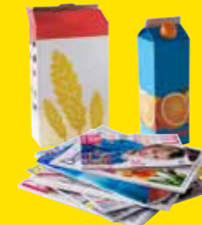
Papiers, emballages et briques en carton