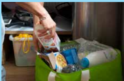
Nouvelles consignes de tri