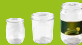
Pots et bocaux en verre

Emballages en plastique, métal, papier-carton