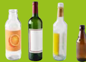
Bouteilles en verre