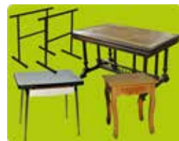
Les meubles pour poser (tables, bureaux)