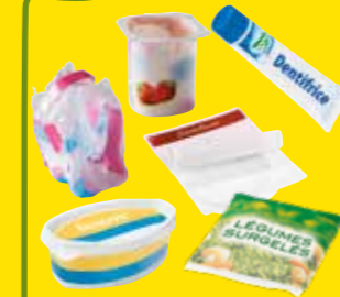
Tous les autres emballages en plastique