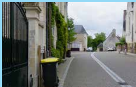
Jours de collecte 2020