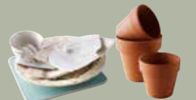
Vaisselle en verre et en porcelaine