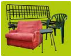
Les meubles pour s'asseoir (sièges, canapés, fauteuils)

Quel que soit le matériau ou l'état, TOUS les meubles, même en morceaux, sont concernés :