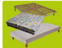
Les meubles de couchage (matelas, sommiers, cadres de lit)