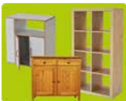
Les meubles de rangement vidés de leur contenu