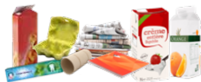
Tous les papiers, cartonnets et briques alimentaires