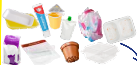
Emballages en plastique

Dans le bac jaune, les emballages à recycler, en vrac