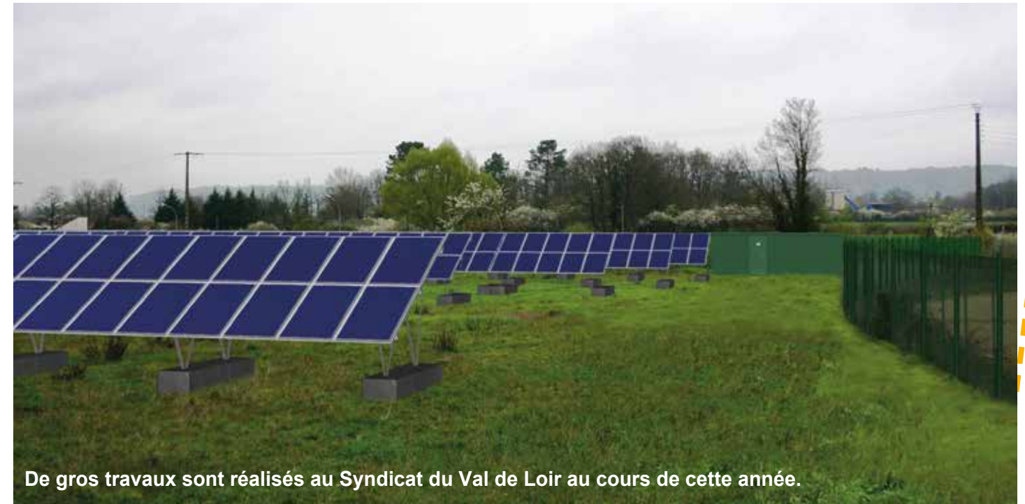
De gros travaux sont réalisés au Syndicat du Val de Loir au cours de cette année.

Le Syndicat du Val de Loir consacre l'année 2021 à de gros travaux de diverses natures : sécurisation des déchèteries, mise en conformité du centre de transfert et installation d'une centrale solaire sur l'ancienne décharge d'Aubigné-racan. Revue de détails.