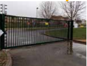
mars 2020 : installation d'une clôture électrique sur la déchèterie de Montval-sur-Loir

En 2020, en raison de nombreuses intrusions constatées dans la déchèterie de Montval-sur-Loir, engendrant des pertes financières pour le Syndicat (baisse des recettes dû au vol de matières, frais de réparations du grillage...) une clôture électrique de détection a été installée autour du site.