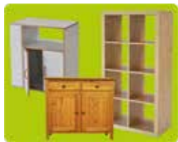
Les meubles pour RANGER vidés de leur contenu