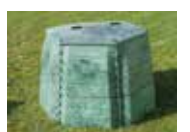
modèle 830 litres, tarif : 40€