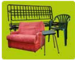
Les meubles pour S'ASSOIR (chaises, canapés, fauteuils)

TOUS les objets, les éléments d'ameublement et d'agencement, sont concernés :