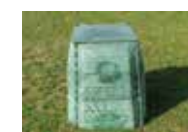
modèle 345 litres, tarif : 20€

Le Syndicat met à votre disposition, pour une somme modeste, des composteurs. Pour toute commande, contactez le Syndicat au 02 43 94 86 50 ou par mail via contact@syndicatvaldeloir.fr